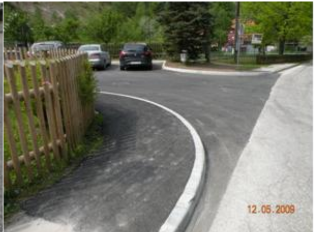
(pred šolo Žerjav)