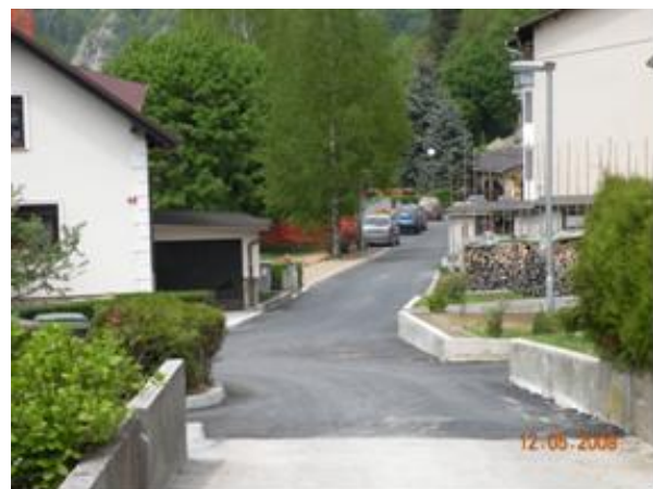
(območje stan. objektov Lampreče – 4 fotografije)