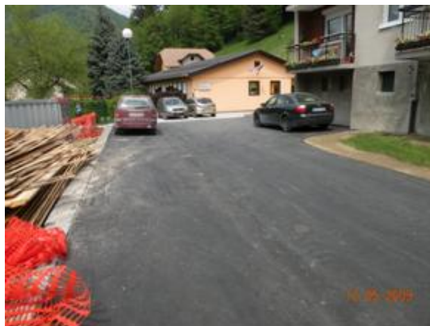
(pred vrtcem Črna)

❖ Spodnje Javorje, območje stan. objektov Stara gozdna uprava – Rezman